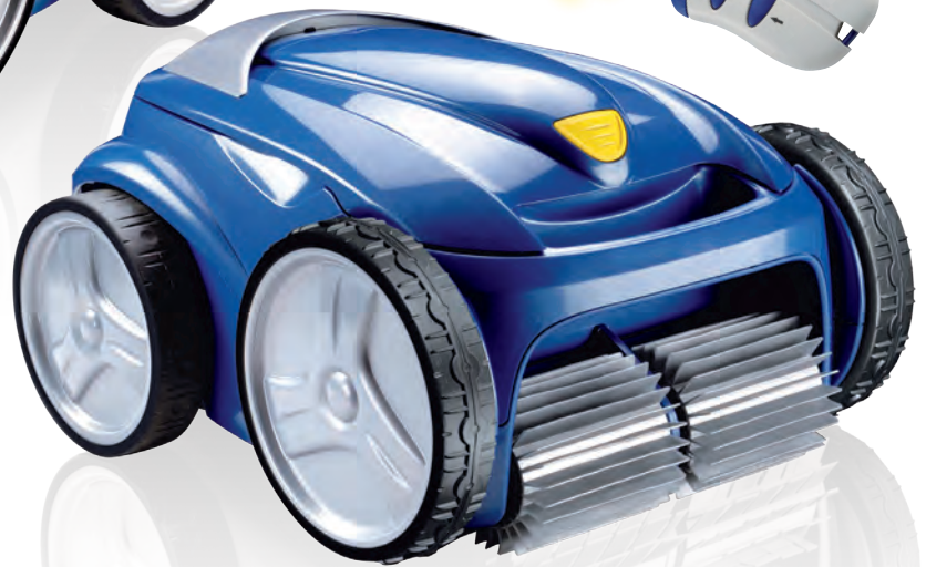
VORTEX 4 Der große Bruder