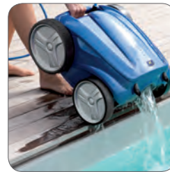
Ergonomischer Griff für eine optimale Handhabung