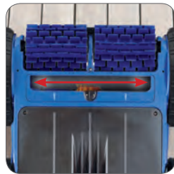
Extra breite Ansaugöffnung, um alle Arten von Schmutzpartikeln anzusaugen