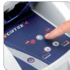
Anpassbare Reinigungszeiten (-30 min./+1 Std.)