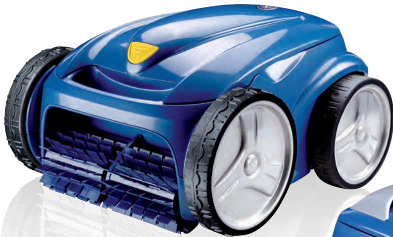
VORTEX 3 Der Bestseller.

Zweifellos die Roboter mit der intelligentesten Konzeption.