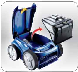
Hygienischer und leicht zu reinigender Filterbehälter